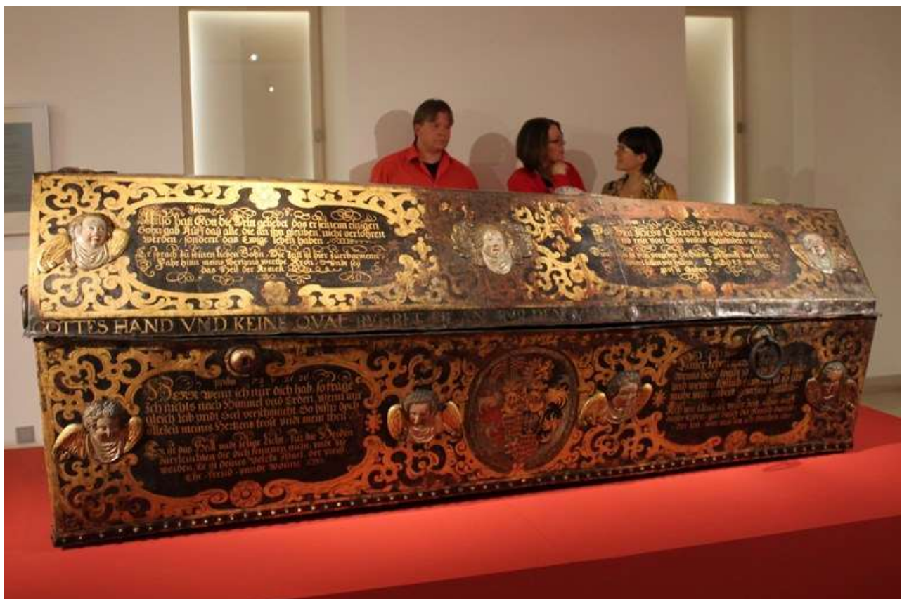
Fig. 1: bara di Heinrich Posthumus Reuss con le iscrizioni messe in musica da Schütz nella prima parte delle Musikalische Exequien . Nelle vignette, la parte superiore è destinata alle citazioni dalla Bibbia, quella inferiore a quelle dai Corali (Gera, Ostfriedhof, Cappella della famiglia Reuss).