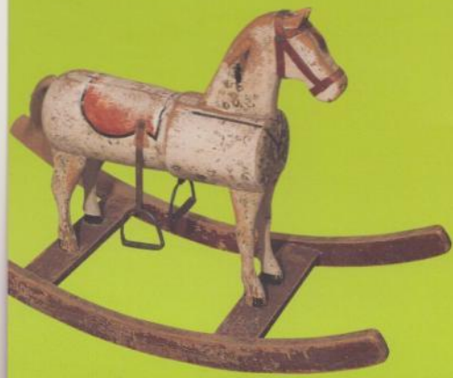
Schaukelpferd, um 1900 Staatliche Museen zu Berlin, Museum Europäischer Kulturen Rocking horse, around 1900 Staatliche Museen zu Berlin, Museum Europäischer Kulturen